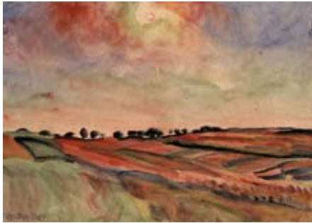
Friedrich Karl Ströher Abendhimmel, 1923 Aquarell auf Papier Hunsrück-Museum Simmern

kannte, entwickelte er für seine charakteristischen Motive eine Handschrift, die mit starken Farben und einer großzügigen Sicht dem Gesamteindruck den Vorrang vor dem Detail gibt.