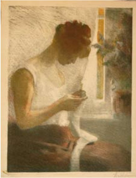
Friedrich Karl Ströher Mädchen am Fenster (Olga), 1909 Lithographie, Kreide auf Papier Hunsrück-Museum Simmern