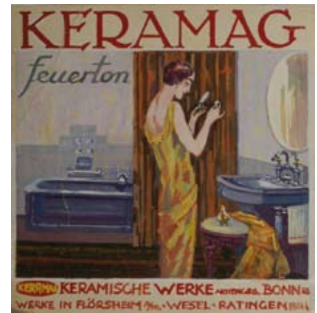
Louis Ziercke Werbung: Keramag, Frau im Bad, um 1925 Entwurf Privatbesitz

Zahlreiche Zeichnungen, Aquarelle und Ölgemälde entstanden. Seine Malweise blieb zwar dem Realismus verbunden, er setzte die stilistischen Mittel des Impressionismus und des Expressionismus gezielt ein. Die Schule Corinths wurde sichtbar.