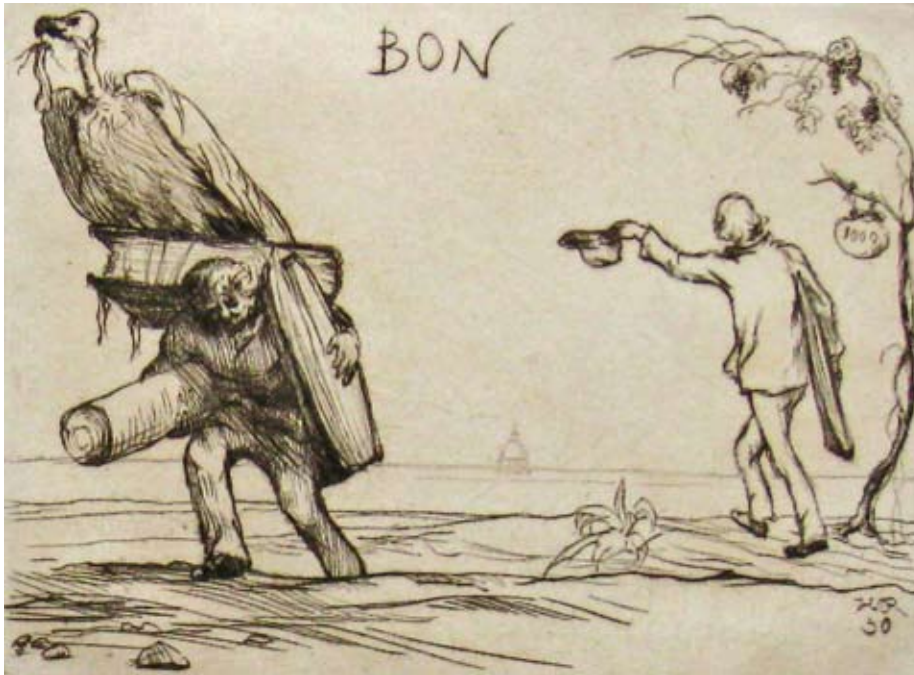
Heinrich Reifferscheid Italien-Bon, 1930 Radierung Heinrich Reifferscheid Gesellschaft