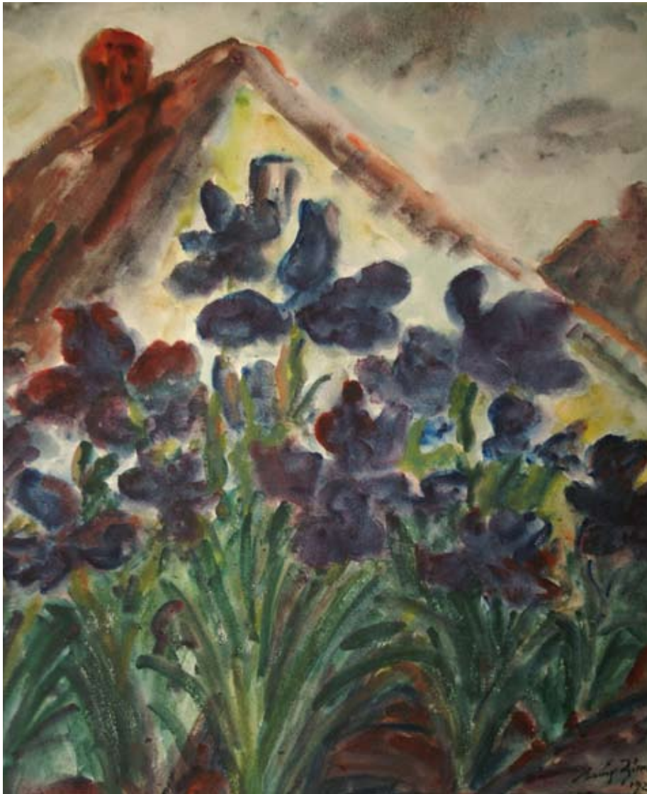
Louis Ziercke Blumen vor dem Haus, 1929 Aquarell Privatbesitz