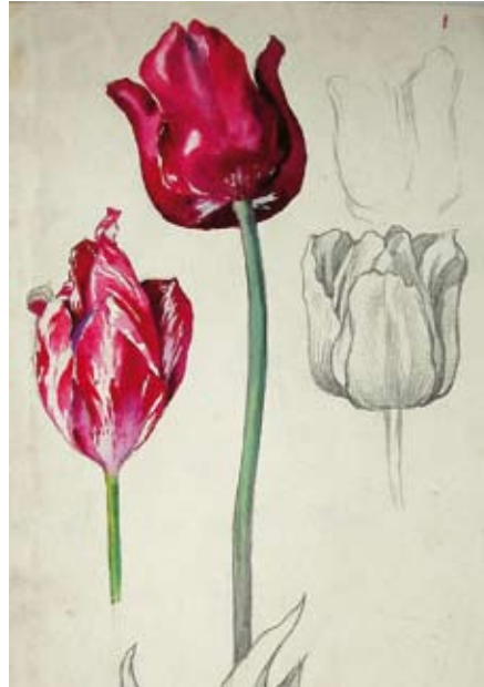
Friedrich Karl Ströher Tulpen, 1900 Aquarell, Bleistift auf Papier Hunsrück-Museum Simmern

sie sich orientierten, der sie zugewandt waren, ohne sich in ihren Ausdrucksformen einschränken oder festlegen zu lassen.