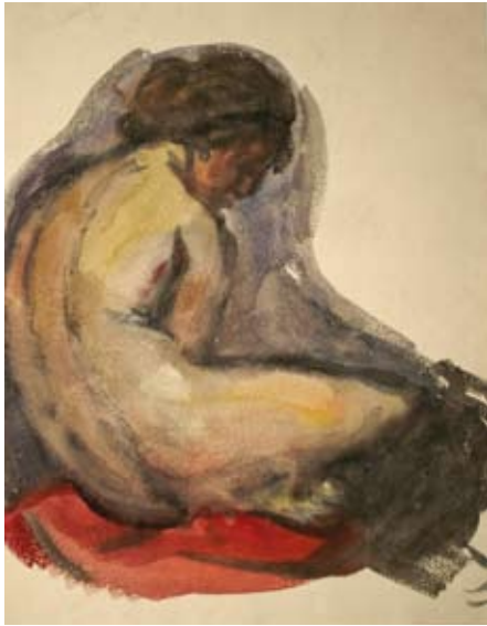
Louis Ziercke Sitzende Aquarell Privatbesitz

er als Lehrer für Freihandzeichnen an der Fortbildungsschule in Godesberg.