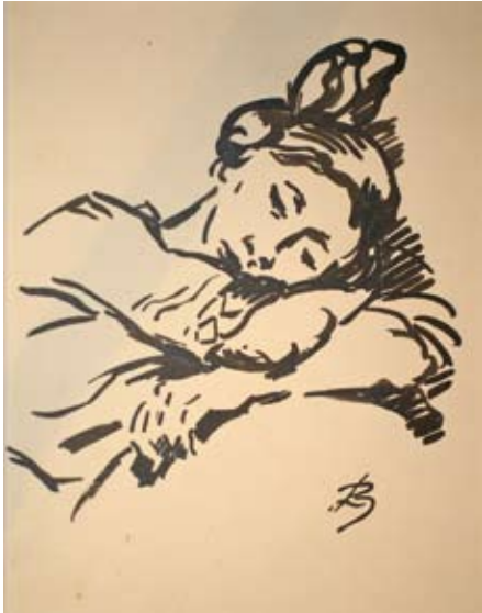
Louis Ziercke Schlafendes Mädchen Tusche Privatbesitz

nach, im StadtMuseum Bonn und im Berliner Zoo mit einer Serie von Tierzeichnungen aus den Jahren 1932 bis 1934, die zum Teil im Kölner Zoo entstanden sind.